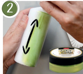
2 Eine erste dünne Lage Inka Gold auftragen und kurz trocknen lassen. Apply a first thin layer of Inca gold and let dry briefly.