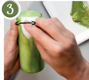
3 Die zweite dünne Lage Inka Gold auftragen und kurz trocknen lassen. Apply the second thin layer of Inca gold and let dry briefly.