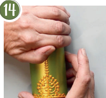
14 Damit das Wachsmotiv gut auf der Kerze haftet, mit warmen Händen andrücken. Press on with warm hands so that the wax motif adheres well to the candle.