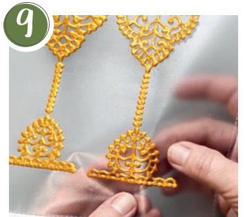
8 Das Motiv vorsichtig von der Prospekthülle abziehen. Carefully peel the motif off the brochure cover.