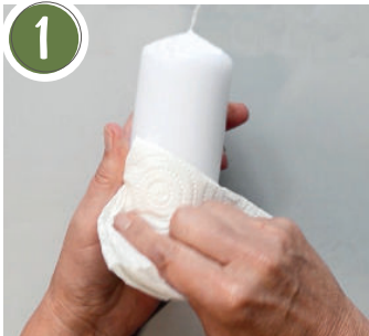
1 Die Kerze mit einem trockenen Küchenkrepp abwischen. Wipe the candle with a dry paper towel.