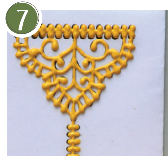
7 Die Prospekthülle mitsamt Motiv für ca. 3 Std. flach in den Kühlschrank legen, danach weiter im Raum durchtrocknen lassen. Place the brochure cover together with the motif flat in the refrigerator for approx. 3 hours, then leave to dry out in the room.