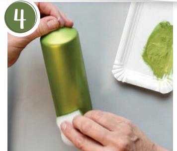
4 Eine dritte dünne Lage Inka Gold auftragen und kurz trocknen lassen. Apply a third thin layer of Inca gold and let dry briefly.